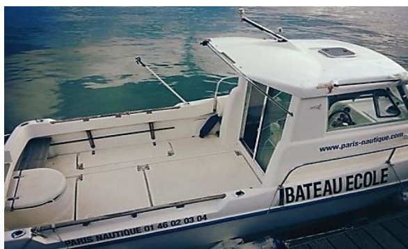
Un de nos 4 bateaux-école