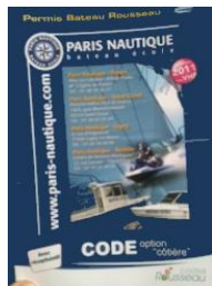
Code Rousseau ed. Paris Nautique & résumé volant