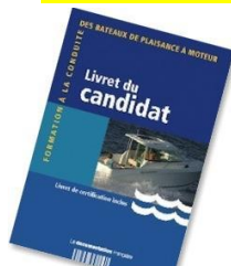
Livret du candidat (& permis provisoire)